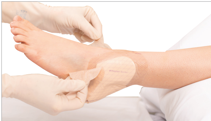
1. Tirer doucement sur les languettes de manipulation pour détacher le pansement de la peau.