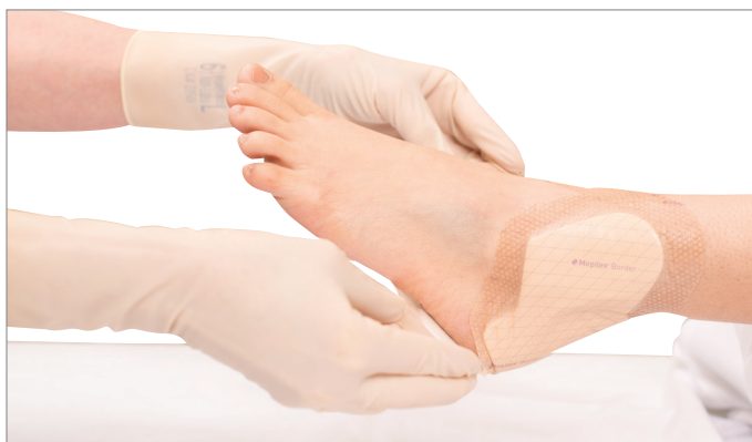
4. Réappliquer la mousse et la bordure du pansement. S'assurer que les rabats sont placés sur les rabats de cheville.