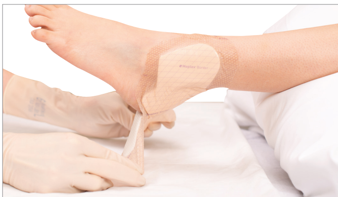
3. Tout en maintenant le pansement sur le bord proximal de « A » (voir photo), évaluer l'état de la peau.