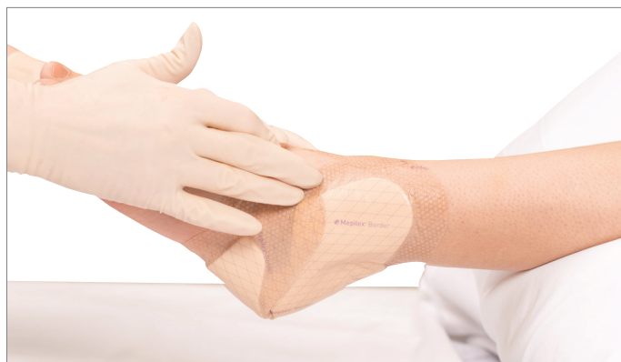
5. Confirmer que le pansement est remis à sa position d'origine, en veillant à ce que la bordure est intacte et à plat.