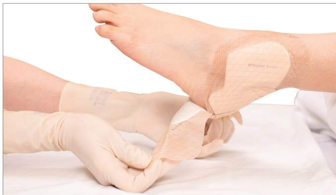
2. Continuer à détacher le pansement de la peau à l'aide des languettes de manipulation jusqu'à ce que la peau soit exposée pour permettre de vérifier celle-ci.