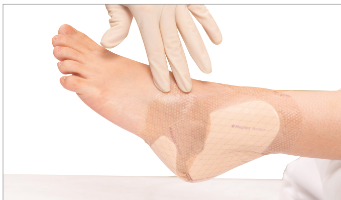
6. Appuyer et lisser le pansement pour s'assurer que l'ensemble du pansement entre en contact avec la peau.